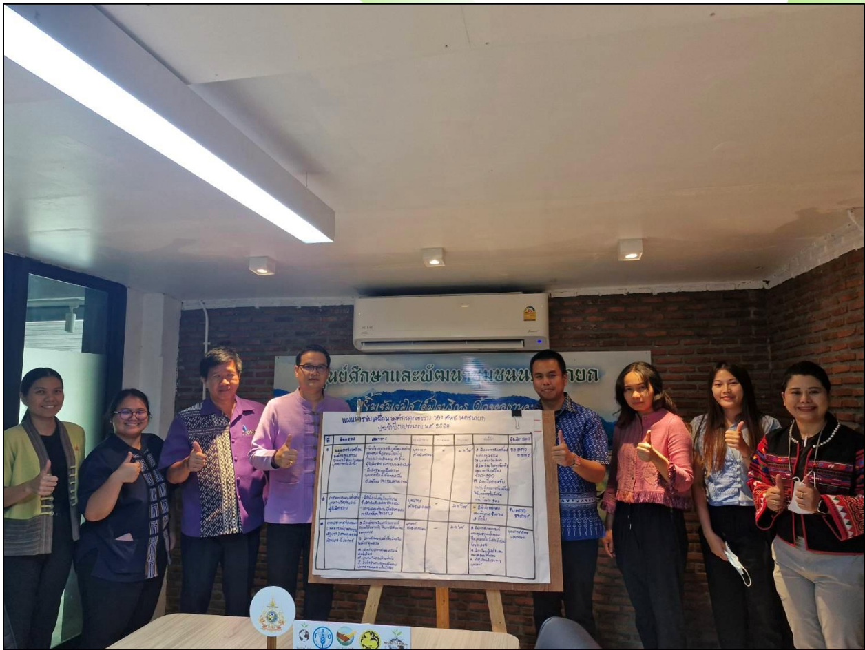
ร้อยละ ๑๐๐ ของบุคลากรในสังกัด ศูนย์ศึกษาและพัฒนาชุมชนนครนายก มีส่วนร่วมในการกำหนด แผนการขับเคลื่อนองค์กรคุณธรรม