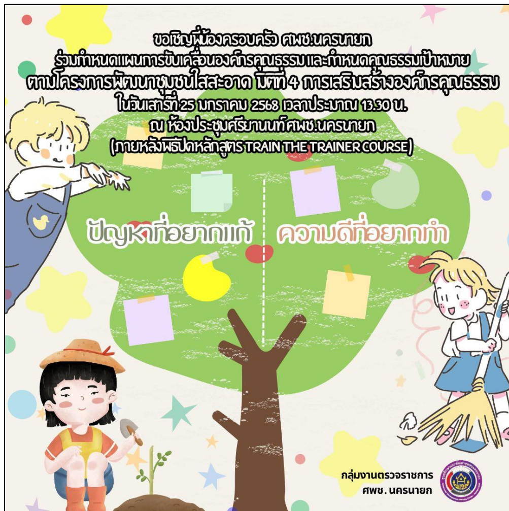
ภาพ INFOGRAPHIC เชิญชวนบุคลากรในสังกัดกำหนดแผนการขับเคลื่อนองค์กรคุณธรรม และคุณธรรมเป้าหมายตามคุณธรรมเป้าหมาย ๕ ประการ ในวันที่ ๒๕ มกราคม ๒๕๖๘ เวลา ๑๓.๓๐ น ณ ห้องประชุมศรียานนท์ ศพช.นครนายก

ศูนย์ศึกษาและพัฒนาชุมชนนครนายก กำหนดจัดประชุมเจ้าหน้าที่ศูนย์ศึกษาและพัฒนาชุมชนนครนายก เพื่อร่วมกันกำหนดแผนการขับเคลื่อนองค์กรคุณธรรม และกำหนดคุณธรรมเป้าหมายตามคุณธรรมเป้าหมาย ๕ ประการ เมื่อวันที่ ๒๕ มกราคม ๒๕๖๘ เวลา ๑๓.๓๐ น ณ ห้องประชุมศรียานนท์ ศพช.นครนายก